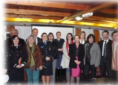
Tertúlia – "O papel da mulher na Protecção Civil".

As dificuldades em assumir papéis num mundo dito de homens ainda é uma realidade, contudo mostraram-se perseverantes em manter e conquistar o seu lugar nesta actividade demonstrando que as suas diferenças são factores positivos para as instituições que representam.