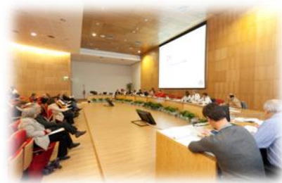
“PMEX SEIXAL I” - Instalação da CMPC, Avaliadores e Observadores. CMS, 2011

O Exercício contou ainda com o apoio do CDOS de Setúbal na constituição de uma Equipa de Avaliadores.