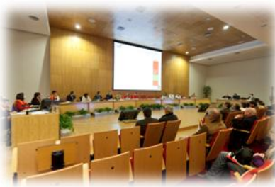
“PMEX SEIXAL I” - Instalação da CMPC, Avaliadores e Observadores. CMS, 2011

Neste âmbito, o Presidente da Câmara e a Comissão Municipal de Protecção Civil em articulação com os Agentes de Protecção Civil e com as Entidades que cooperam nesta matéria, actuaram como se de situações reais tratassem, desenvolvendo as acções necessárias para a resolução dos incidentes.