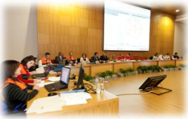
"PMEX SEIXAL I" – A CMPC e o SMPC. CMS, 2011

O teste ao plano foi ainda alvo de uma avaliação final conjunta realizada pela CMPC, SMPC e Equipa de Avaliadores, resultando daí um Relatório Final do Exercício.