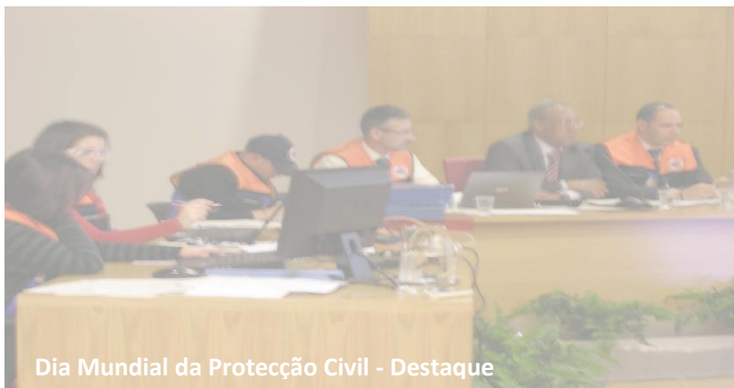
Dia Mundial da Protecção Civil - Destaque