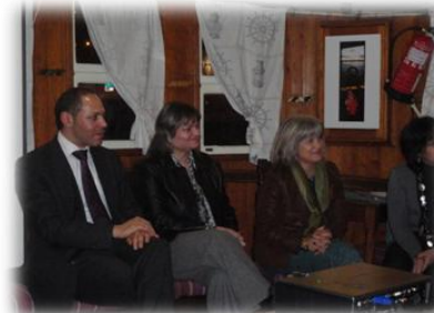
Moderadores Tertúlia – "O papel da mulher na Protecção Civil".