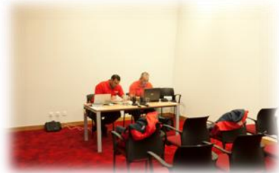
"PMEX SEIXAL I" - O Posto de Comando Municipal. CMS, 2011.

Colocaram-se vários actores em inter-acção, ainda que, com papéis diferentes, considerando-se deste modo que num cenário real é o conhecimento e as boas práticas entre os actores que garantem parte do sucesso da resposta e gestão da emergência.